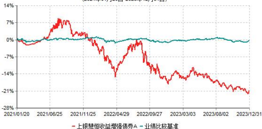
上银慧恒收益增强债券A累计净值增长率与业绩比较基准收益率历史走势对比图 (2021年01月20日-2023年12月31日)