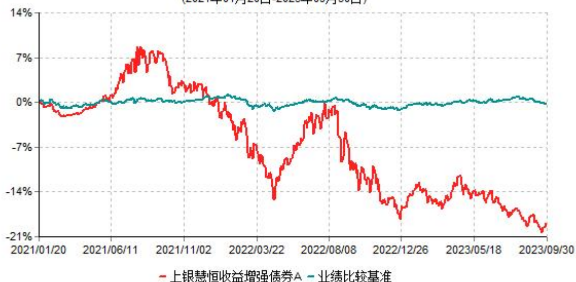
上银慧恒收益增强债券A累计净值增长率与业绩比较基准收益率历史走势对比图 (2021年01月20日-2023年09月30日)