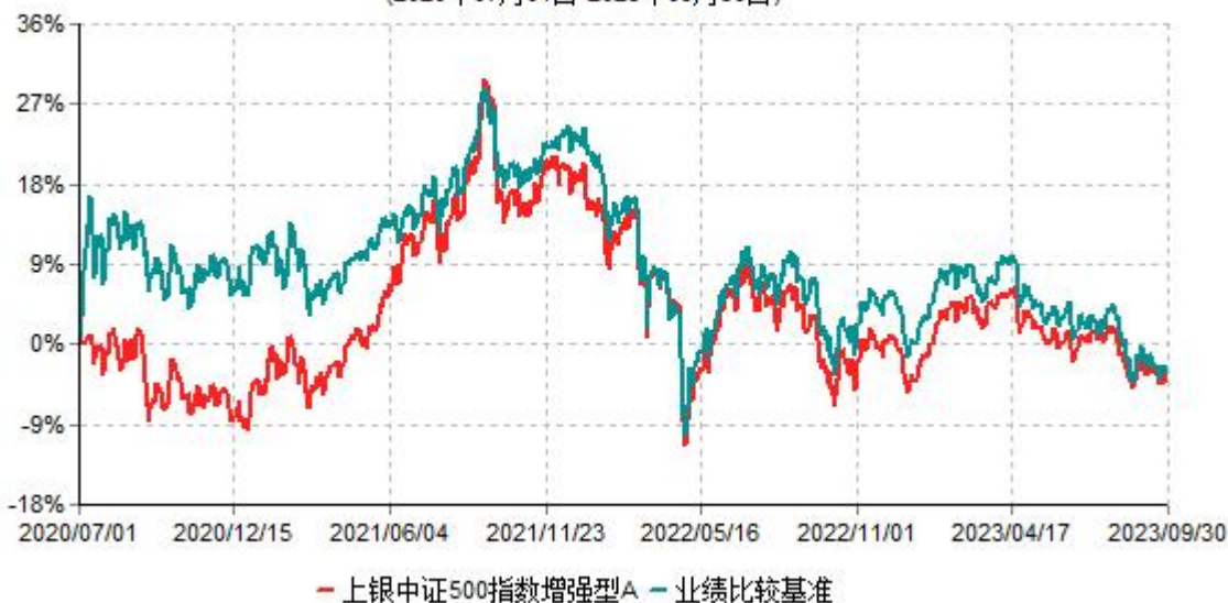
上银中证500指数增强型A累计净值增长率与业绩比较基准收益率历史走势对比图 (2020年07月01日-2023年09月30日)