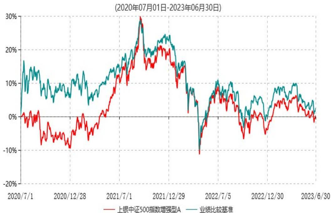
上银中证500指数增强型A累计净值增长率与业绩比较基准收益率历史走势对比图