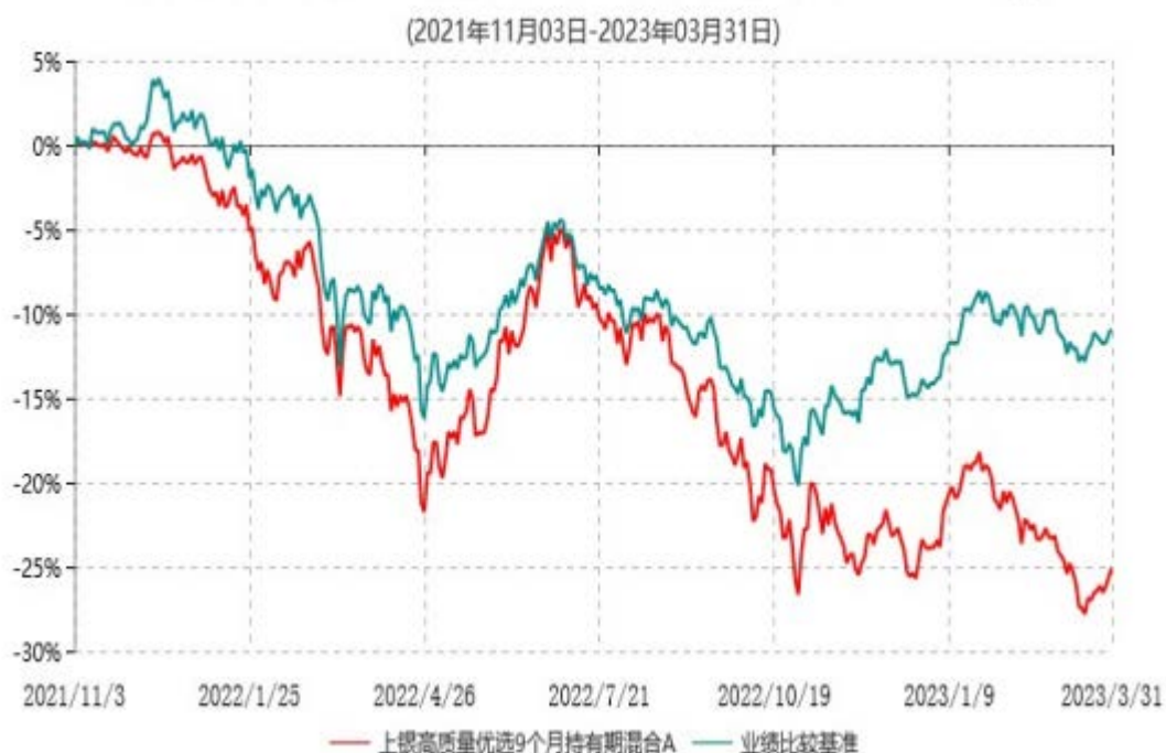
上银高质量优选9个月持有期混合A累计净值增长率与业绩比较基准收益率历史走势对比图