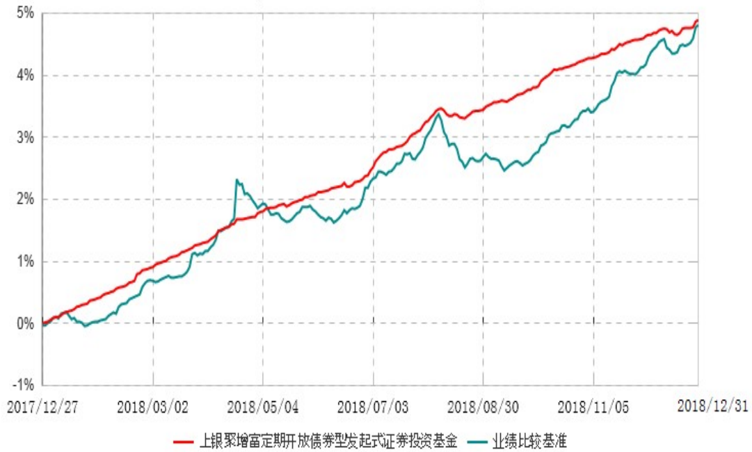
上银聚增富定期开放债券型发起式证券投资基金累计净值增长率与业绩比较基准收益率历史走势对比图 (2017年12月27日-2018年12月31日)